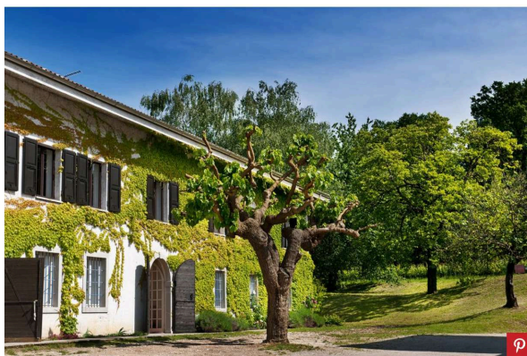
Castello Di Buttrio

Terra complessa e unica, il Friuli Venezia Giulia ha quel fascino che si riserva ai luoghi di confine. Porzione orientale d'Italia, vivace e calibrato insieme di popoli, culture e lingue, in Friuli il dualismo si legge in primis nel nome stesso: da un lato la porzione di Udine, Pordenone e Gorizia, dall'altro quello della Venezia Giulia con Trieste. In questo melting pot culturale, distinto e orgoglioso, non viene risparmiato il versante gastronomico. Meta per amanti del vino , in Friuli si trova ancora una cucina resistente e autoctona, come quella del Castello di Buttrio . Una tenuta che spunta tra le colline dei Colli Orientali friulani , in provincia di Udine, con una lunga storia di appartenenza a questo territorio.