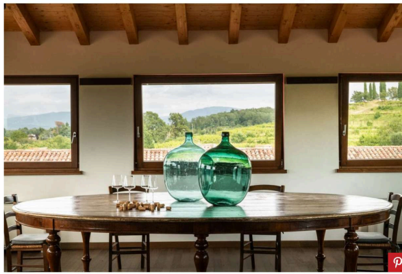
Castello Di Buttrio