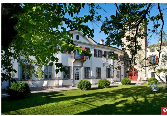
Castello Di Buttrio

Già nel Medioevo si hanno notizie dalla spiccata tendenza enoica del Friuli e soprattutto della zona su cui sorge il Castello di Buttrio. Alcuni documenti datano l'erezione delle mura orlate del castello già nel XI secolo, poi distrutte, in una posizione strategica e a dominare la vallata. L'attuale castello è stato ricostruito nel 1600 e da allora è stato dimora di numerose famiglie, dai Signori di Buttrio ai Morpurgo fino a diventare, nel 1994, proprietà di Marco Felluga. Uno dei più noti produttori di vino in Italia, Felluga iniziò insieme alla sua famiglia un importante lavoro di restauro e recupero di questo pezzo di storia friulana e delle sue vigne, portandole a nuovo corso.