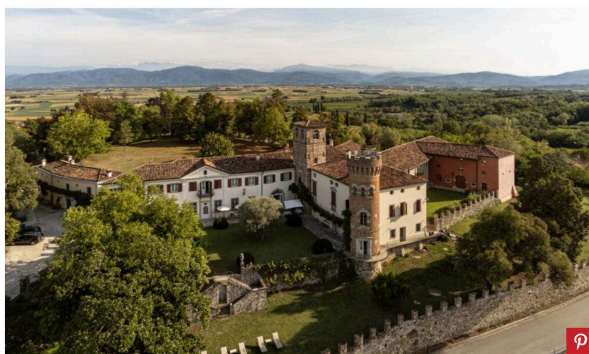
Castello Di Buttrio

DI MARTINA DI IORIO PUBBLICATO: 01/12/2023