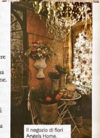
Il negozio di fiori Angels Home. In basso. La locandina del Far East Film Festival.