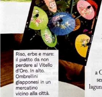
Riso, erbe e mare: il piatto da non perdere al Vitello d'Oro. In alto. Ombrellini giapponesi in un mercatino vicino alla città.