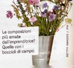
Le composizioni più amate dall'imprenditrice? Quelle con i boccioli di campo.