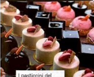
I pasticcini del Caffè Beltrame. In basso. Il Bosco Romagno, a 20 km da Udine.