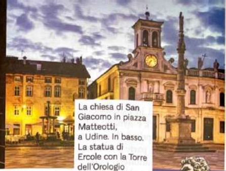
La chiesa di San Giacomo in piazza Matteotti, a Udine. In basso. La statua di Ercole con la Torre dell'Orologio in piazza della Libertà.